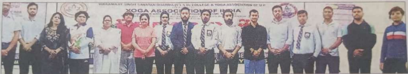
नवाबगंज स्थित वीएसएसडी कॉलेज में हुई पांचवीं नेशनल योग चैंपियनशिप में विजयी खिलाड़ी व आयोजक।